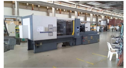
Inyectora termoplástico 450 ton.con robot SEPRO BATTENFELD BA 4500-1900BK Ref: 17591