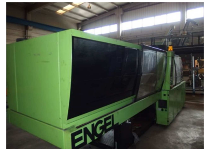
Inyectora termoplástico 175 ton.Interface robot ENGEL ES 750/175 HLST Ref: 17532