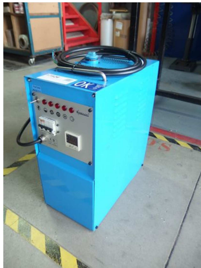
Atemperador molde aceite 3 kw. KOSMON K 9 Ref: 17526