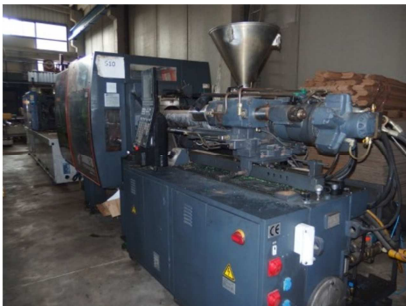
Inyectora termoplástico 125 ton.Interface robot. SANDRETTO NOVE T 125/650 Ref: 17533