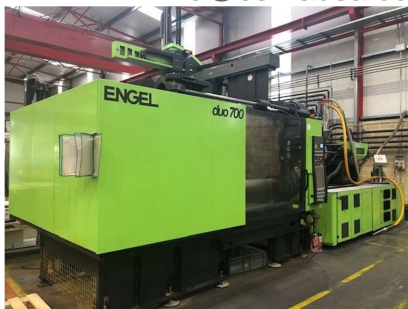
Inyectora termoplástico 700 ton. robot ENGEL. ENGEL DUO 5550/700 PICO Ref: 17592

Este mes de Enero 2019 puede empezar con nuevos proyectos para las empresa de transformados plásticos, y con ello pueden necesitar incorporar máquinas para estos nuevos procesos,es por lo cual les presentamos 21 productos de sector plástico con descuentos de hasta el 40% en algunos productos. Estos productos ofertados se entregan en embalaje en palet con cargo 10 y 20 euros, o a granel en el caso de maquinas. La carga está siempre incluida sobre camión mediante puente grúa o carretilla. Para más detalles no dude en consultar directamente por teléfono al 936664932 o info@cemausa.com . La duración de esta oferta es hasta final de mes Enero.