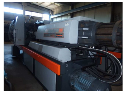
Inyectora termoplástico 380 ton.Con robot SANDRETTO OTTO 380/2054 Ref: 17455