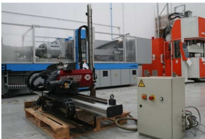
Robot cartesiano hasta 300 ton. WITTMANN W620N Ref: 17535