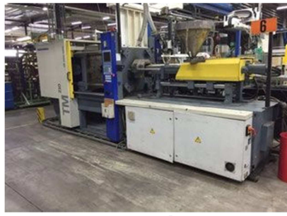
Inyectora termoplástico 210 ton. BATTENFELD TM 2100/1000 Ref: 17530