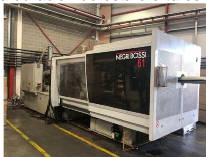
Inyectora termoplástico 485 ton. NEGRI BOSSI V4800/4100 Ref: 17590