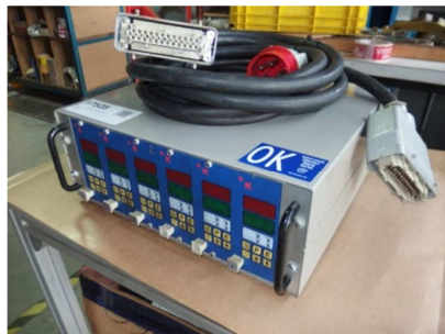
Atemperador molde 6 zonas 3000 watos. KOSMON K6 Ref: 17525