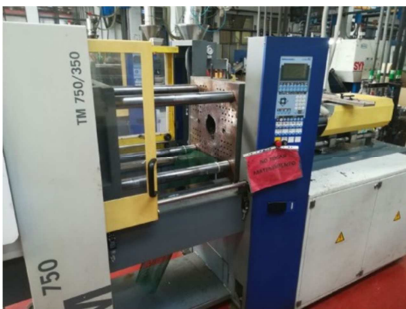
Inyectora termoplástico 75 ton.Interface robot. BATTENFELD TM 750/350 Ref: 17528