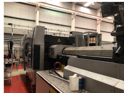
Inyectora termoplástico 400 ton.HIBRIDA.Packaging OIMA STRATOS 3400/400 KP Ref: 17541