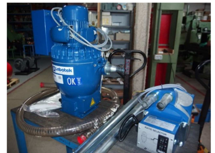
Cargador trifásico 0,37 kw. válvula proporcional LABOTEK PGT4/M312 Ref: 17518