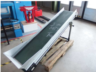
Cinta transportadora plana 2000x400 mm. CRIZAF LSE/2004 Ref: 17475