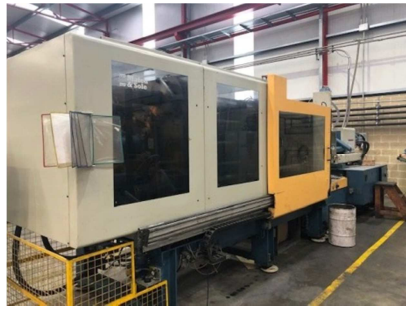
Inyectora termoplástico 400 ton.Interface robot. MATEU&SOLE METEOR 2400/400 Ref: 17594