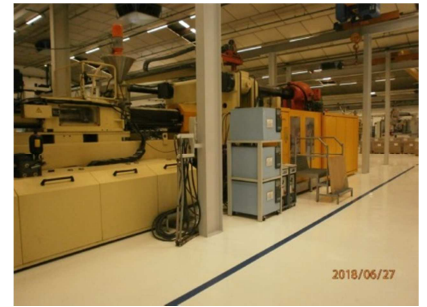
Inyectora termoplástico 1650 ton. con robot. HUSKY QUADLOC 1650 RS115 Ref: 200191