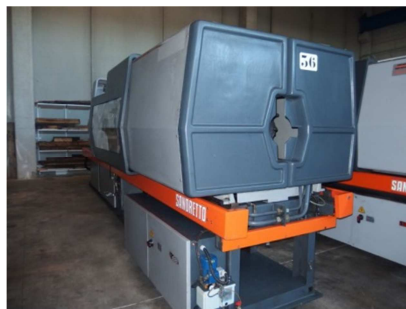
Inyectora termoplástico 270 ton. SANDRETTO OTTO 270/1334 Ref: 17454