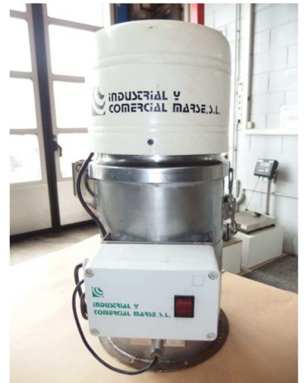
Cargador monofásico 110 kgs/hora COMERCIAL MARSE MA-3 ECO Ref: 17510