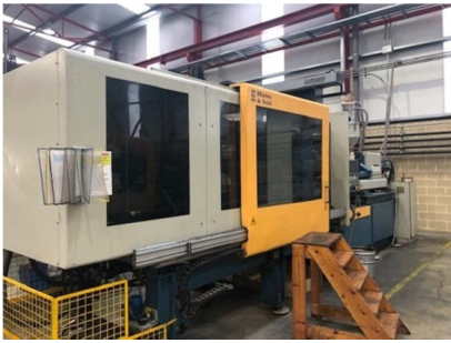
Inyectora termoplástico 400 ton.Interface robot. MATEU&SOLE METEOR 2400/400 Ref: 17593